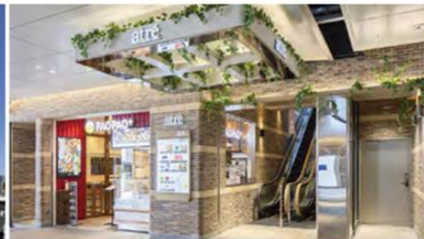
【アトレ五反田1】 開業：2008年3月14日 SC階数：地上5階 SC延床面積：1,138㎡ 店舗面積：791㎡ 【アトレ五反田2】 開業：2020年3月26日 SC階数：地上3階 SC延床面積：1,107㎡ 店舗面積：740㎡