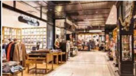
開業：2004年3月3日 SC階数：地上4階 SC延床面積：9,772㎡ 店舗面積：5,043㎡