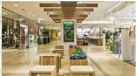
【アトレ大井町】 開業：1993年3月11日 SC階数：地上7階 SC延床面積：24,353㎡ 店舗面積：9,516㎡ 【アトレ大井町2】 開業：2011年3月3日 SC階数：地上3階 SC延床面積：1,477㎡ 店舗面積：950㎡