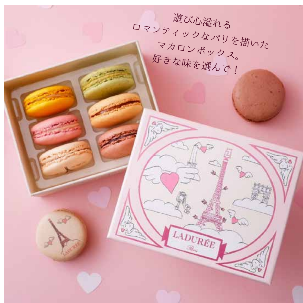
アムール・ド・パリ マカロン6個入 3,456円～ ※プリントマカロンの数により値段が変わります。