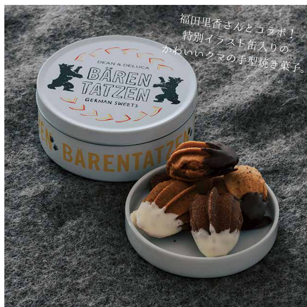
バーレンタツェン ギフト缶・S 4個入り 1,944円