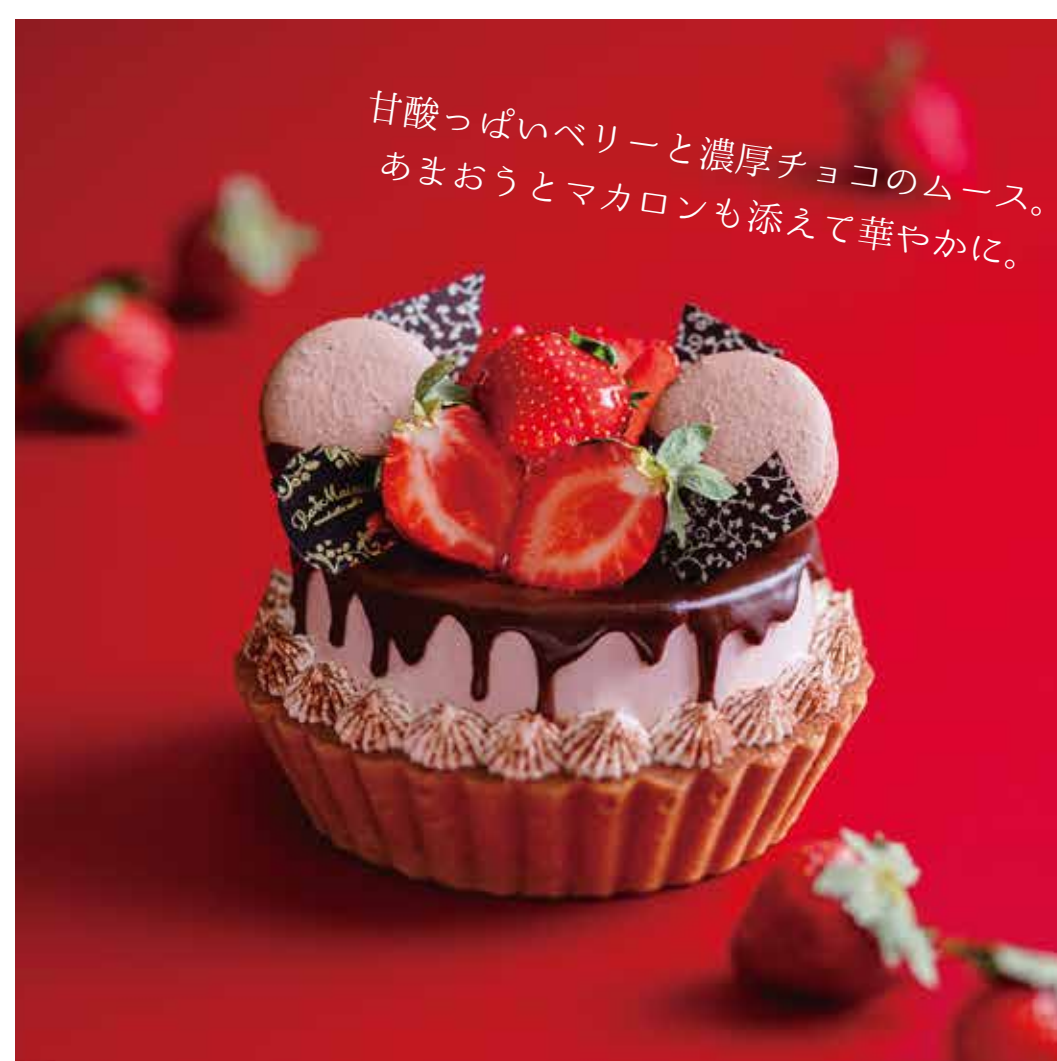
あまおうとメルティ・ストロベリームースのタルト 4,580円