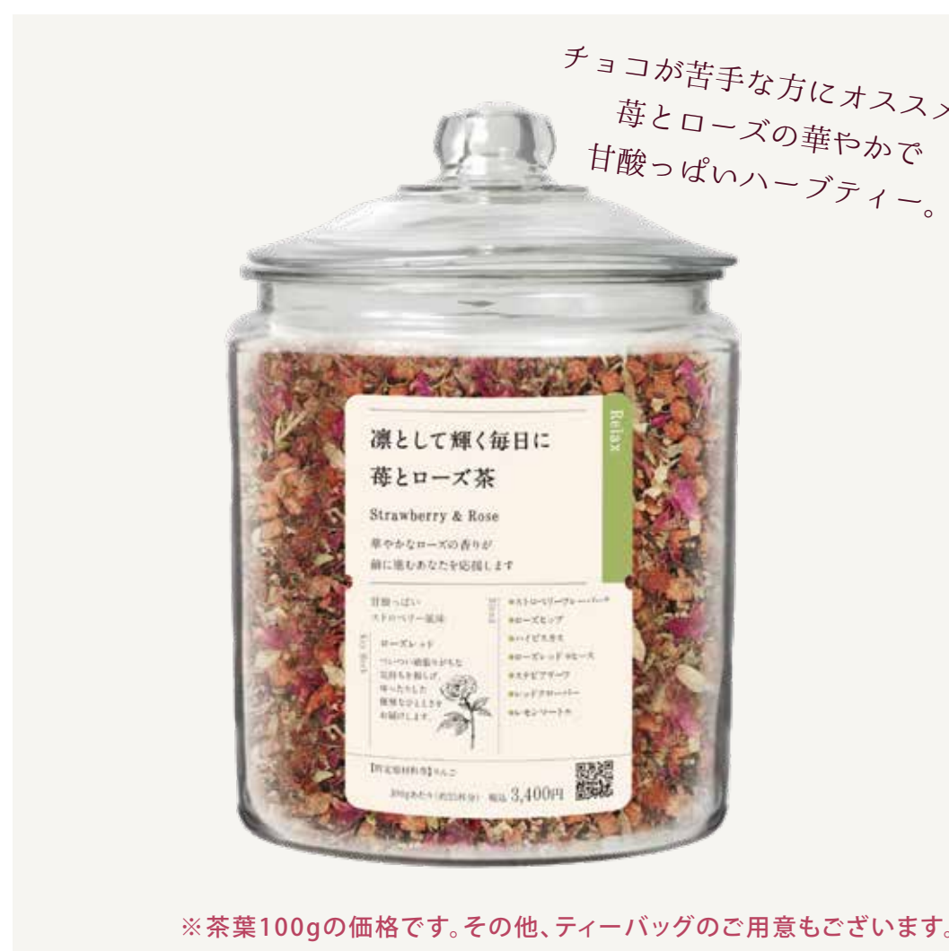
※茶葉100gの価格です。その他、ティーバッグのご用意もございます。 凛として輝く毎日に 苺とローズ茶 3,400円 / 茶葉100g