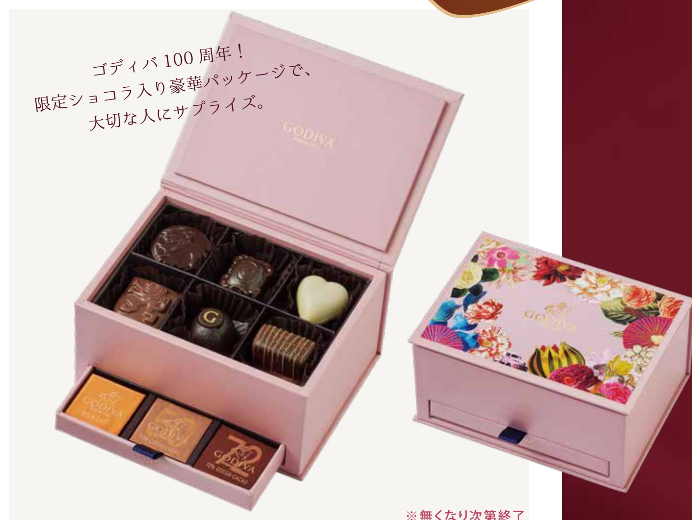
※無くなり次第終了 100年の遊び心 グランプラス 12粒入 6,264円