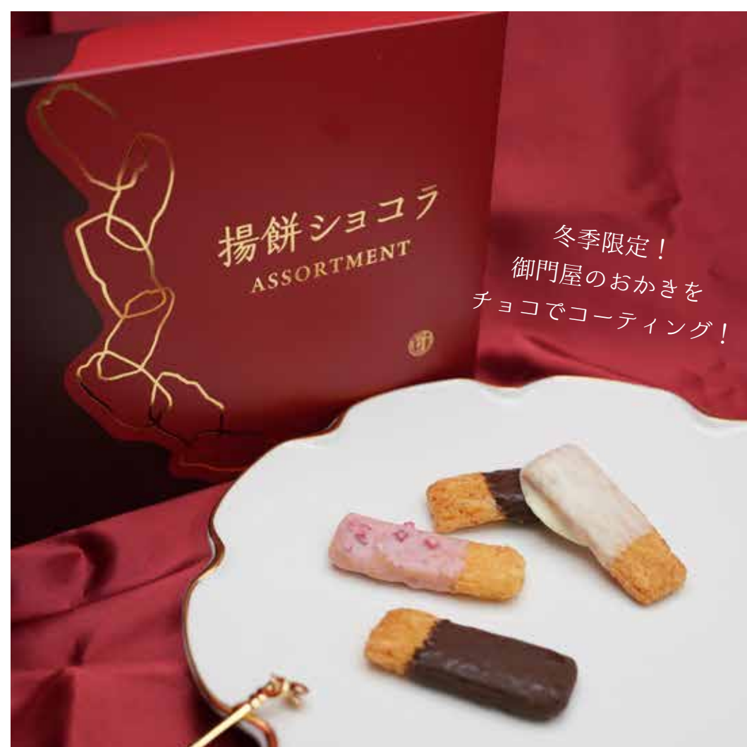
揚げもちショコラ 1,790円