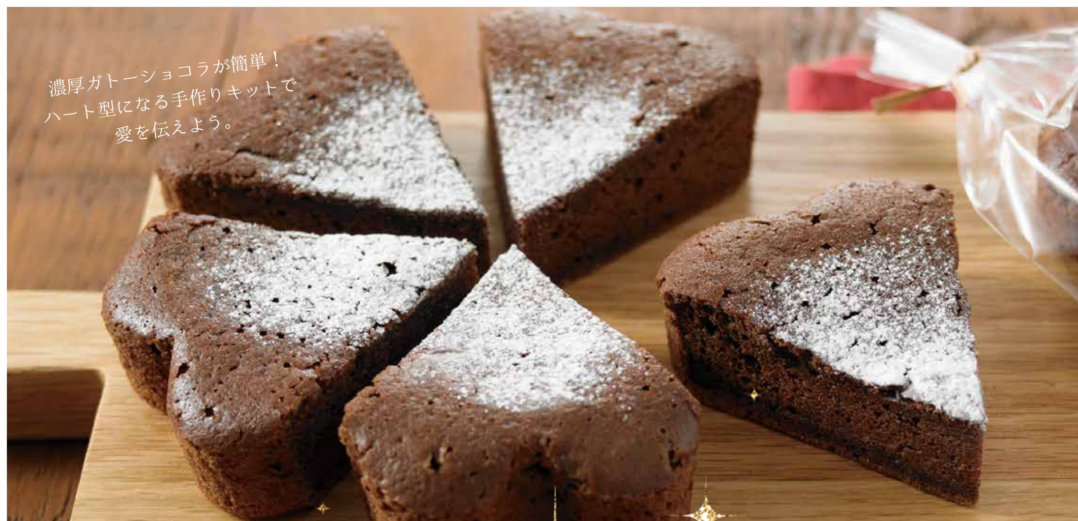
自分でつくる ガトショコラ 1,100円