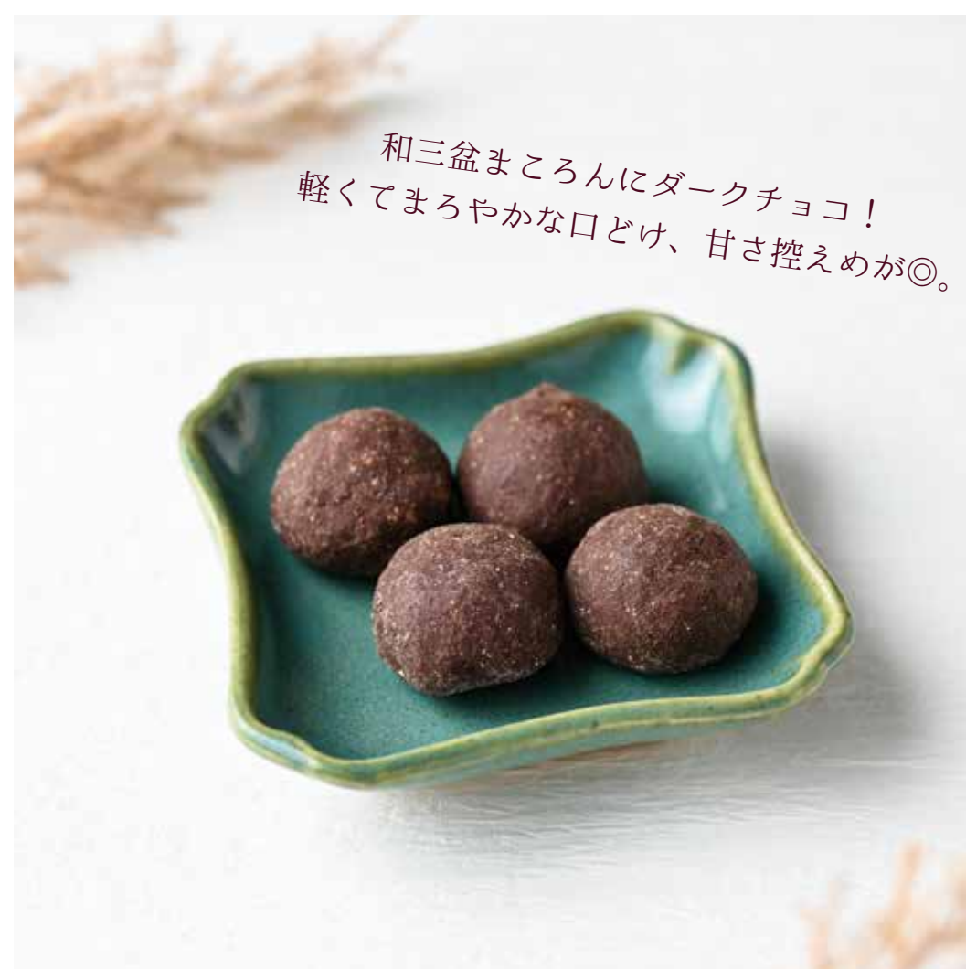
てつがく者かもしか (まころんダーク) 486円