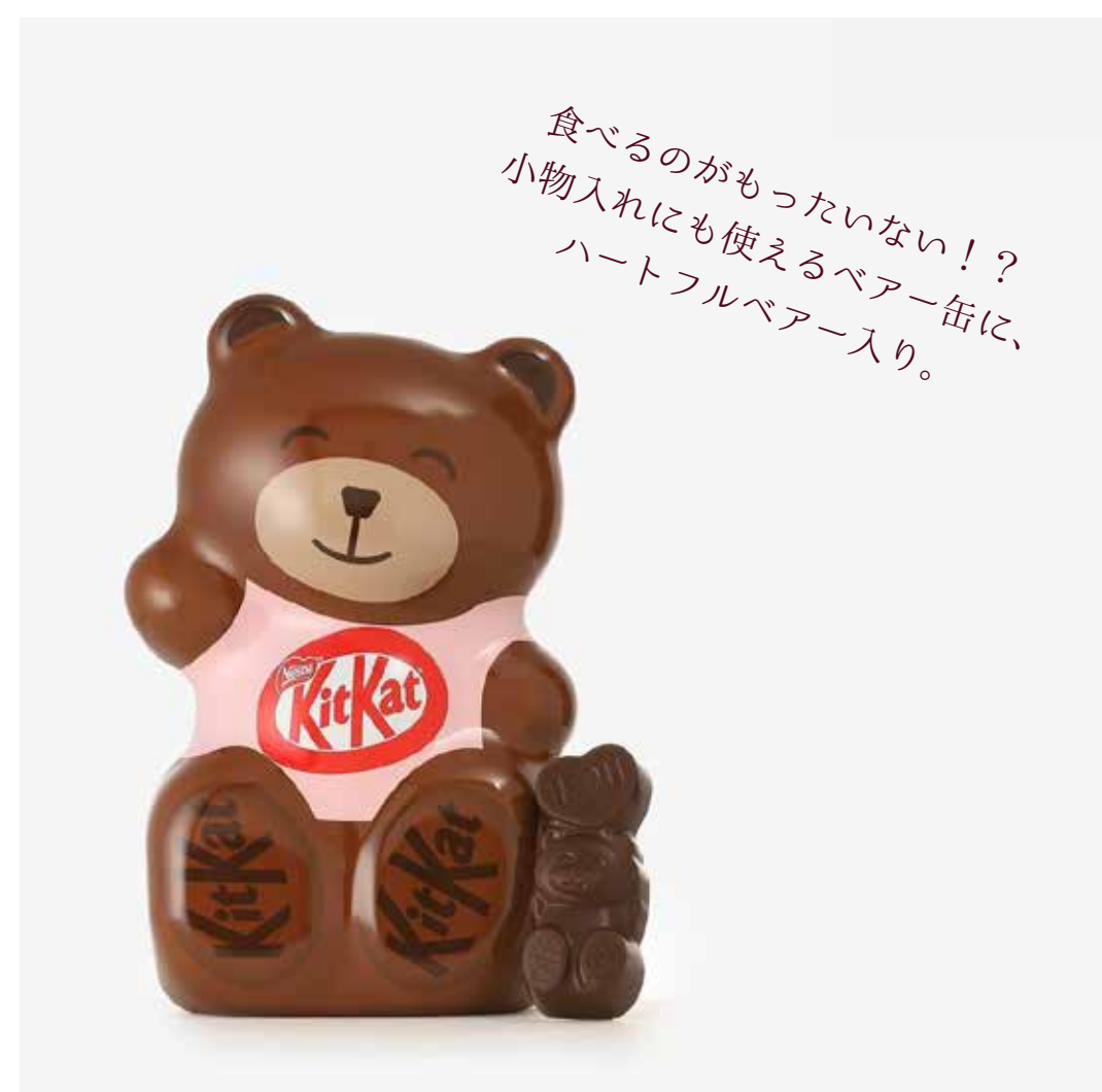
キットカット ハートフルベアー ベアー缶 (6個入り) 1,620円