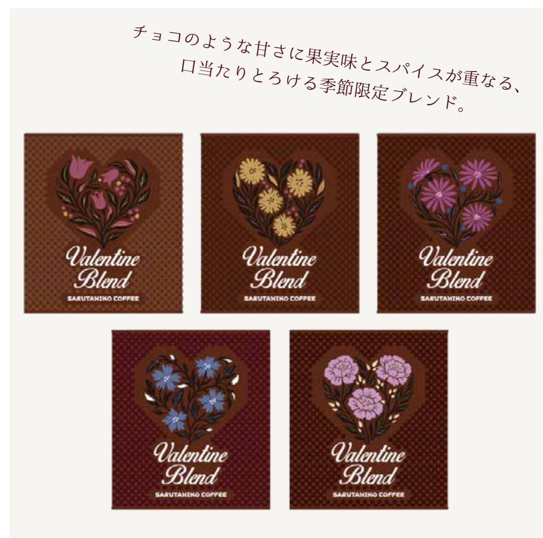
バレンタインブレンドドリップバッグ 1,200円