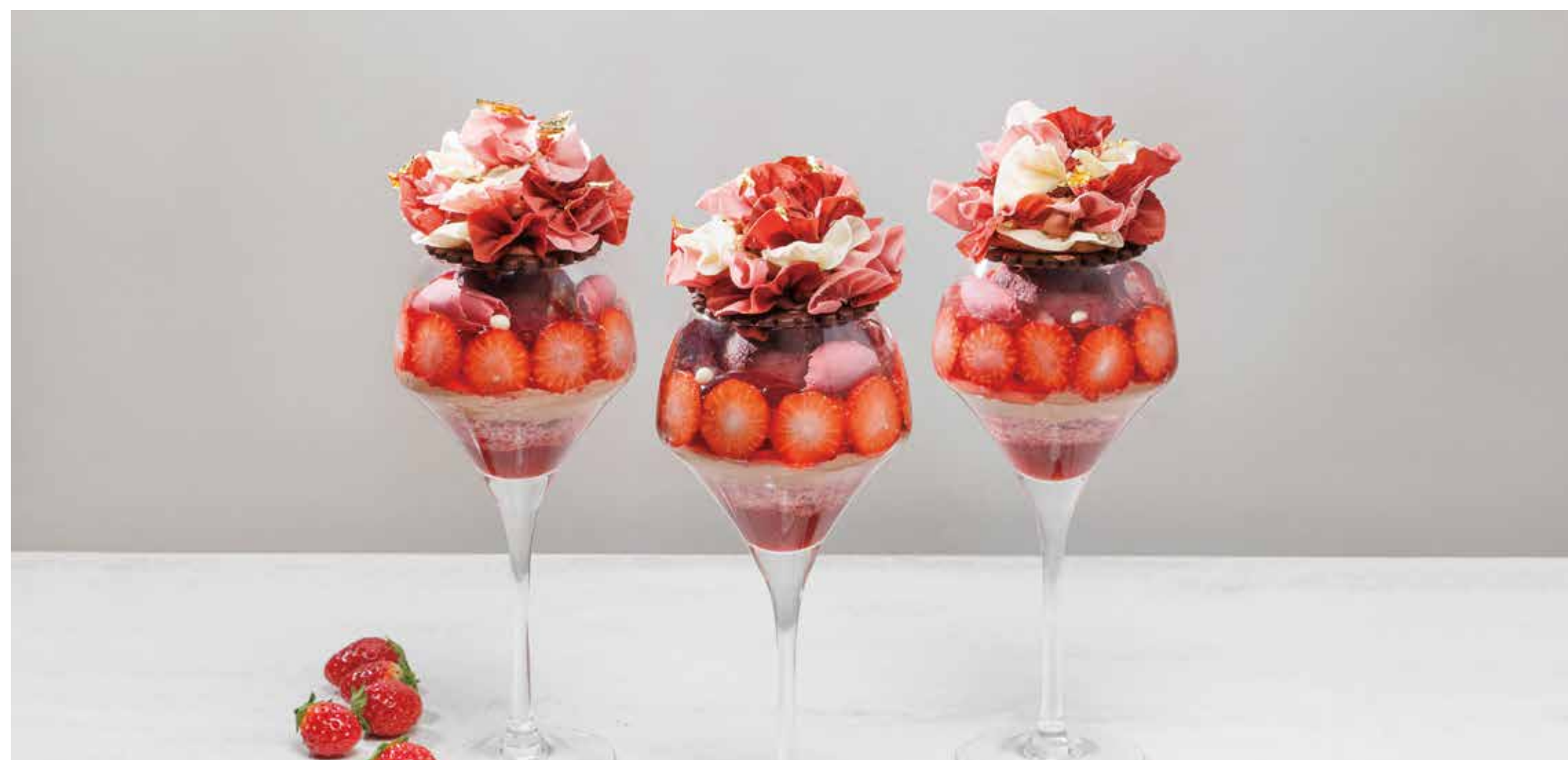
パフェドブーケ フリュールージュ 4,950円