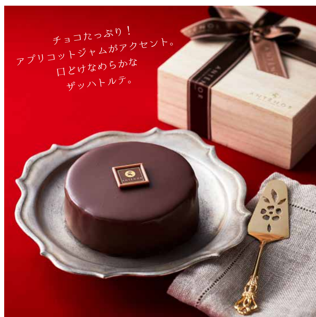
アンテノール・ザッハトルテ 2,376円