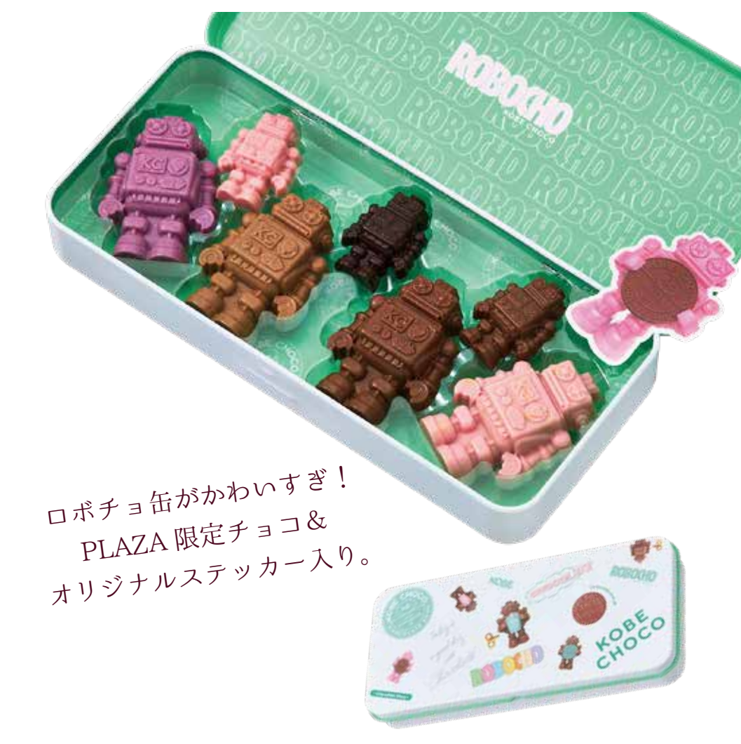
※数量限定・無くなり次第終了 販売期間：2026年1月10日(土)～2月14日(土) KOBÉ CHOCO ロボチョコ 缶 オリジナルアソート 1,485円