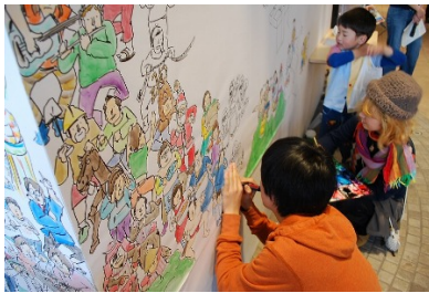
※写真は4月のチャリティイベントの様様

今回の「アトレ吉祥寺 Thanks Anniversary Fair」のメインビジュアルを手がけ、4月に行われたチャリティイベントにも参加した、吉祥寺在住のアーティストユニット uwabami(ウワバミ) が、はなびの広場にてライブペイントを開催！今回の目玉は、なんといってもお客様を絵の中に描いてしまうこと。「観る」だけではないアートを是非お楽しみください。