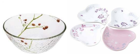
3/31(土) NARUMI ボウル