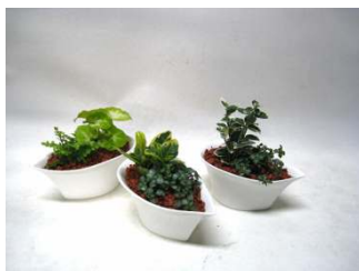
3/30(金) グリーンプランター