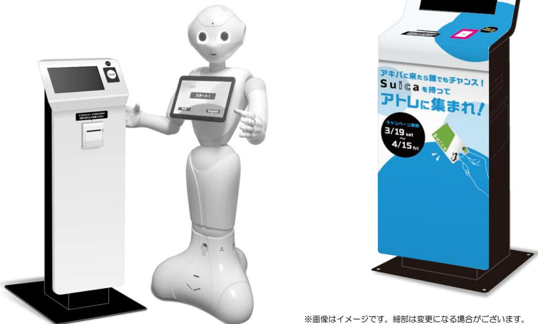
※画像はイメージです。細部は変更になる場合がございます。