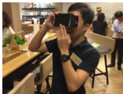
7月にタイ・バンコクで開かれた熊本地震 関連のイベントの様子