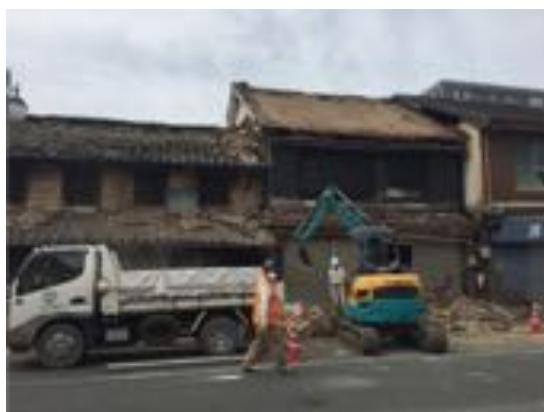
熊本地震でダメージを受け、取り壊される町屋