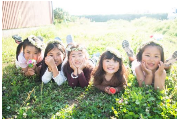
笑顔を見せる熊本地震の被災地の子供たち