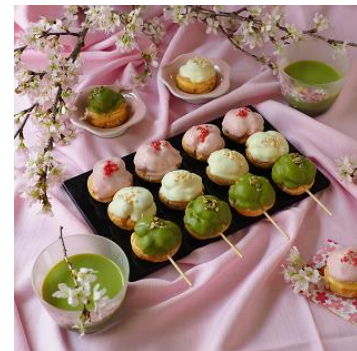
●3色団子風プチシュークリーム