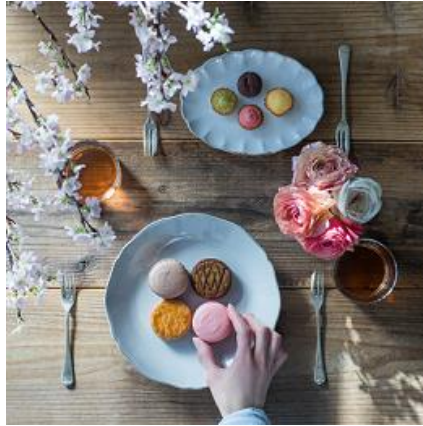
●お花見アイテムはバスケットに入れて持ち運び！