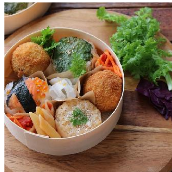
●海老とそら豆の落とし揚げ弁当