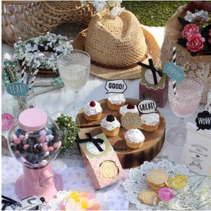
●小物を使用してフォトジェニックに

http://event.atre.co.jp/sakura2018/coordinate