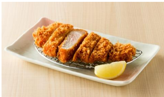
とんかつ 豚肉 お料理 純 (とんかつ)