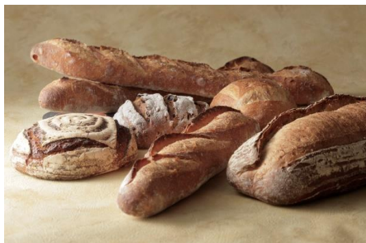
ブーランジェリー ブルディガラ (ベーカリーカフェ)