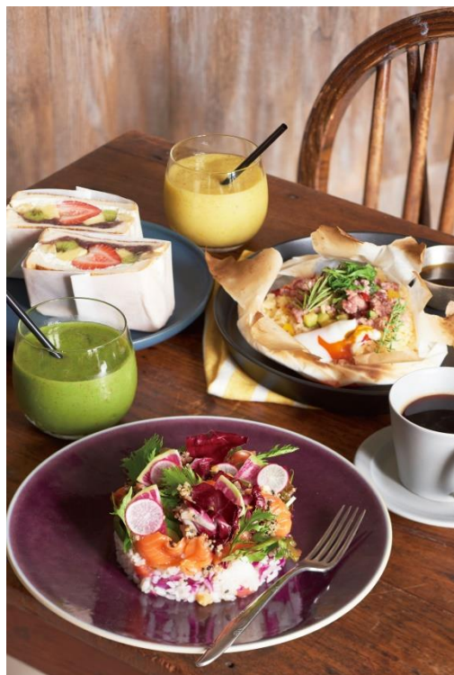
キハチカフェ (カフェ)

埼玉県初出店4店舗、新業態1店舗がオープン。料理人がプロデュースするカフェ「キハチ カフェ」、生どら焼き専門店「DOU」、イートインコーナーを併設したベーカリーカフェ「ブーランジェリー ブルディガラ」等が埼玉県初登場。こだわりのショップが揃います。