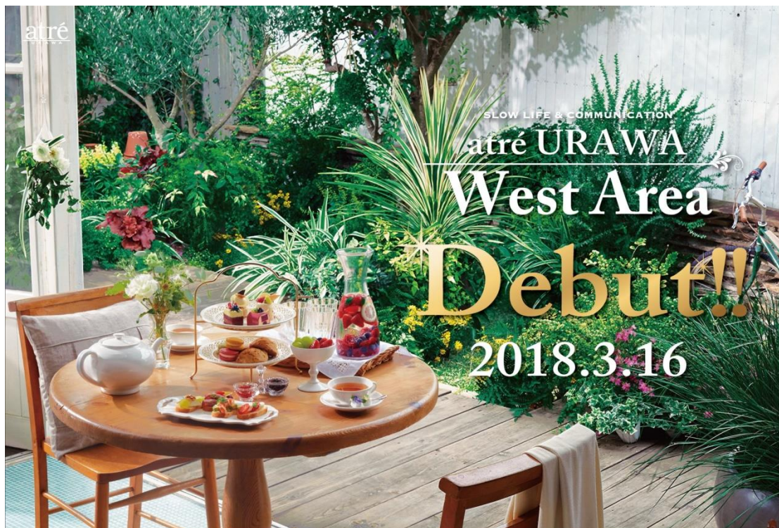
<アトレ浦和 West Area 開業ビジュアル>

今回のグランドオープンでは、浦和駅をご利用される方々のクイックニーズに対応したベーカリーカフェや、季節感が楽しめる食や雑貨のショップ、様々なシーンでご利用頂けるレストラン、美や健康を意識したショップがオープン。地元企業や地産池消の商品展開を行うショップも導入し、地域の魅力を発信して、地域の皆様に新しい価値を提供します。また、開業記念の限定商品の販売や、オープニングイベントも多数開催いたします。