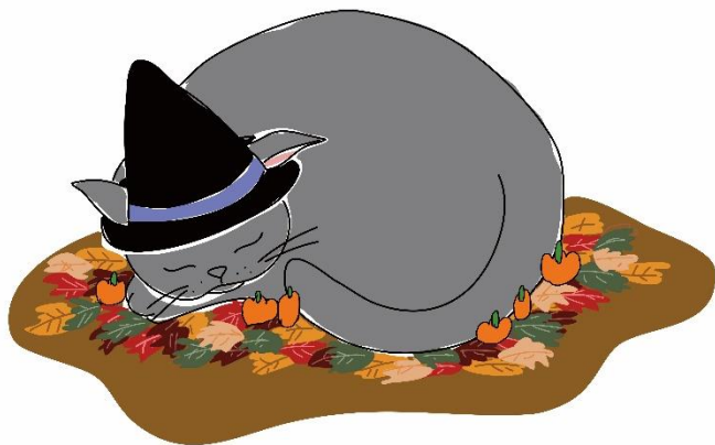
■ 大きな眠り猫のフォトスポット <場所> 1F ツバキひろば