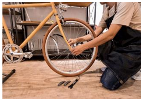
自転車タイヤ交換体験イメージ