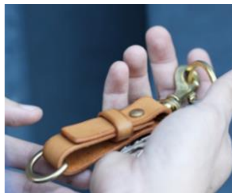
革キーホルダー作成体験イメージ