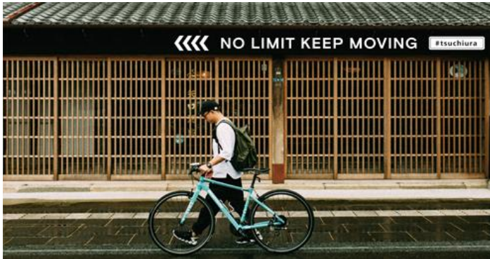
イベントイメージビジュアル