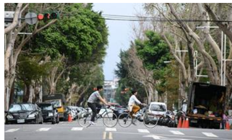
オリジナルサイクルツアーイメージ

<詳細> https://www.facebook.com/tokyobiketw