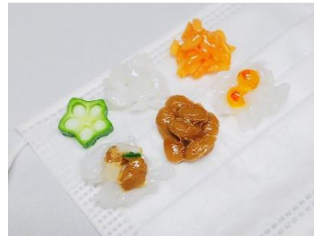
↑マスクアクセサリ