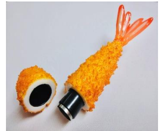
↑海老フライ印鑑カバー