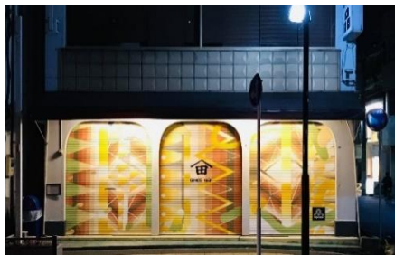
「山田屋の家庭用品」

開催日程：10月2日(土)～4日(月) 開催時間：PM1:00～PM6:00 開催場所：3F いろどりステージ