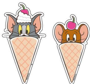
オリジナルステッカー (全2種ランダム配布)

公式ホームページ： https://www.village-v.co.jp/news/event/8630