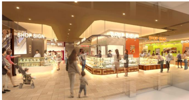
▲1Fデリカゾーン イメージパース(夕方)