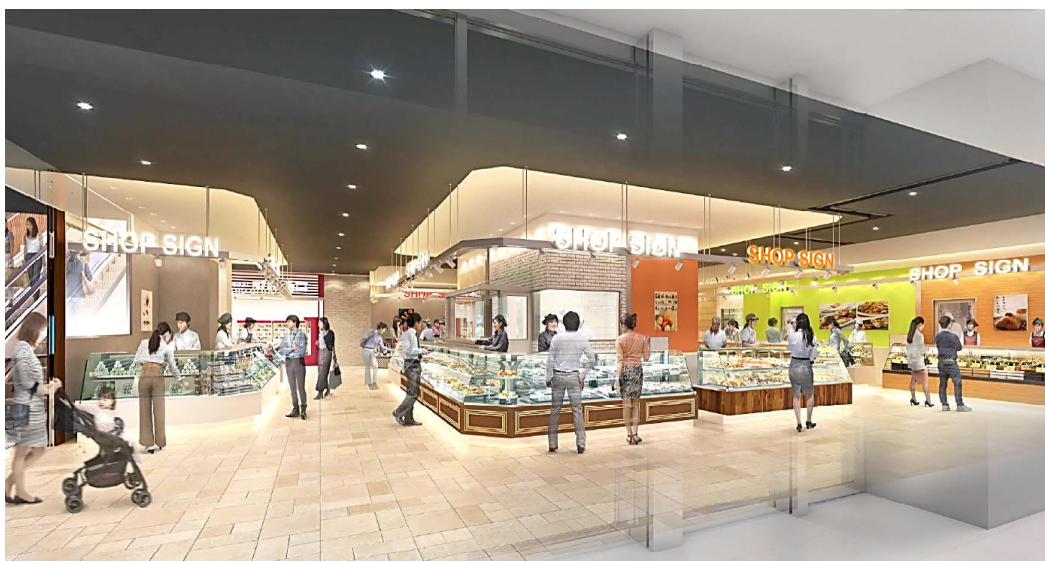
▲1Fデリカゾーン イメージパース

株式会社アトレ(本社：東京都渋谷区、代表取締役社長：一ノ瀬 俊郎)が運営するアトレ大井町(所在地：東京都品川区)では、2023年7月12日(水)に1Fデリカゾーンがリニューアルオープンします。長きに亘り地域のお客様にご愛顧をいただいていた既存6ショップのリニューアル、新規出店となる5ショップを迎え、地域の皆様の食卓を更に便利に楽しく彩ります。