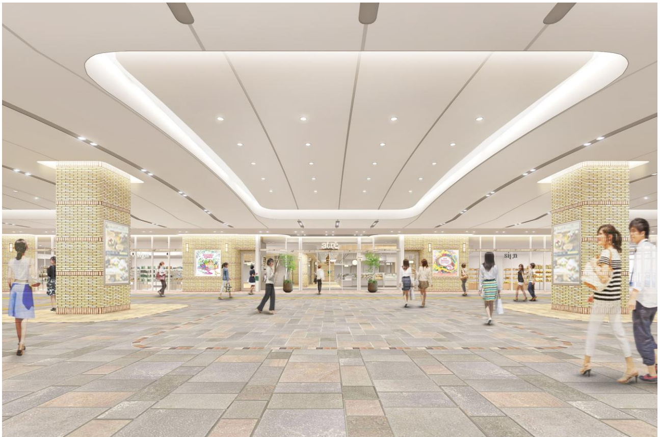
南北自由通路イメージ