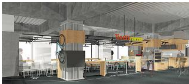
&lt;ショップイメージ&gt;

「皆さまのココロとカラダをゲンキにしたい」という思いから生まれた、「おもてなし No.1」を目指すドラッグストア。サイクリスト向けのエナジードリンクやエナジーバー、アメニティセットなども数多く取り揃えています。