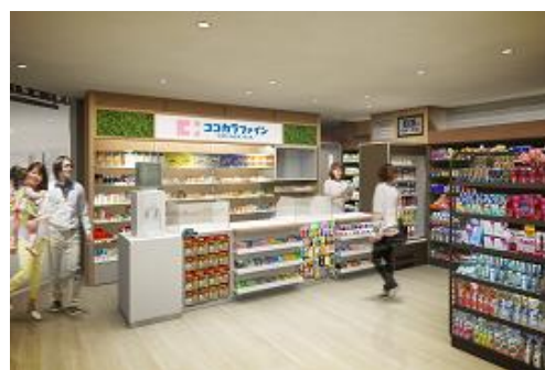
&lt;ショップイメージ&gt;

PLAYatre TSUCHIURA では、オープンを記念した様々なイベントを開催します。