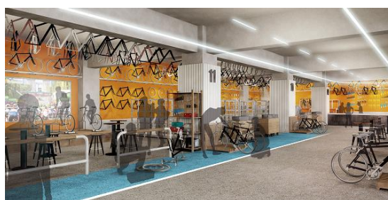
<ショップイメージ>